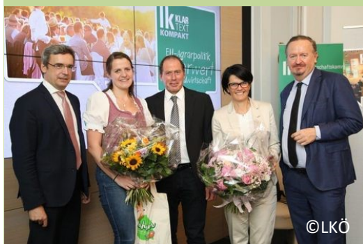
Das hochkarätige Podium der Veranstaltung

Conclusio dieser Veranstaltung war eindeutig, dass die österreichische Landwirtschaft einen Mehrwert für die Gesellschaft leistet. Dieser Mehrwert der Landwirtschaft, der über die Produktion von qualitativ hochwertigen Produkten hinausgeht, muss auch in der GAP nach 2020 seinen Niederschlag finden.