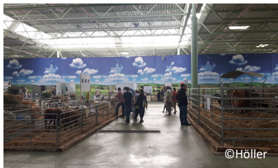
Kleiner Überblick über die Messehalle, links Schafe und Ziegen, rechts Rinder