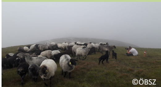
Rasseportraits und Landschaftsaufnahmen vom Profi – als Teil des neuen Corporate Design des ÖBSZ

https://www.soscisurvey.de/Schafdiplomarbeit/?q=Milchschafhaltung