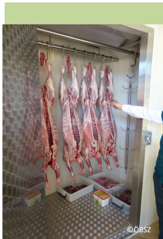
Für die Abgabe an den Endverbraucher am Betrieb geschlachtete Tiere sind beschaupflichtig. Schlachtung für den Eigenbedarf (Verzehr des Fleisches im eigenen Haushalt) ist weiterhin ohne Beschau möglich.