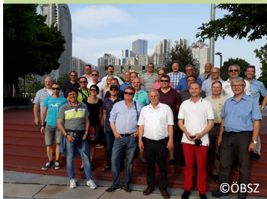
Bundesobmann Georg Höllbacher informierte sich über die landwirtschaftliche Produktion in China.

Neben der Besichtigung von verschiedenen Fleisch-, Obst- und Gemüsegroßmärkte bzw. Bauernmärkten, Farmen, Schlachthöfen und Verarbeitungsbetrieben bot sich immer wieder die Gelegenheit, direkt mit den Verantwortlichen vor Ort zu sprechen. Darüber wurde ein offizielles Treffen mit einem Experten aus der Nutztier-Forschungs-Abteilung des chinesischen Ministeriums arrangiert.