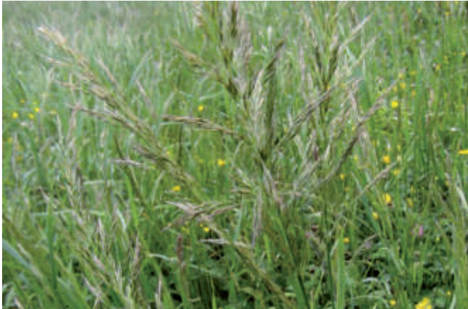
Abb. 4 | Goldhafer ist auch als Heu und Silage giftig