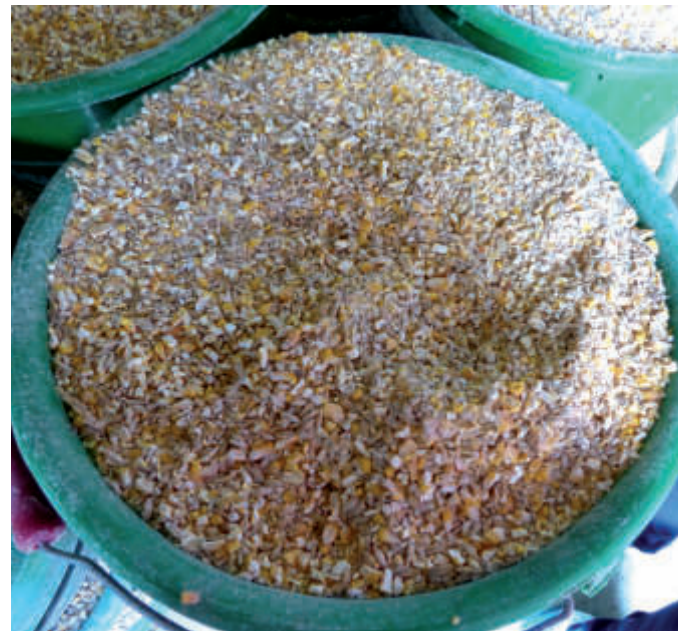
Abb. 1 | Kraftfuttermenge an die Tierleistung anpassen

Jeder Wiederkäuer reagiert auf zu rasche Erhöhung der Kraftfuttergaben, mit Pansenübersäuerung (Pansenazidose), daher sollte das Futter langsam angepasst werden.