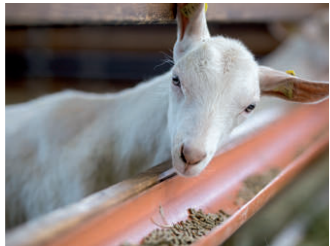
Abb. 2 | Kraftfuttergaben nur langsam erhöhen

Stoffwechselerkrankungen hängen oft wechselseitig mit anderen Krankheiten zusammen. So können sich Ketosen begünstigend auf die Entstehung von Euterentzündungen auswirken und Euterentzündungen wiederum das Auftreten von Ketosen fördern. Ähnlich verhält es sich bei Moderhinke und Endometritiden.